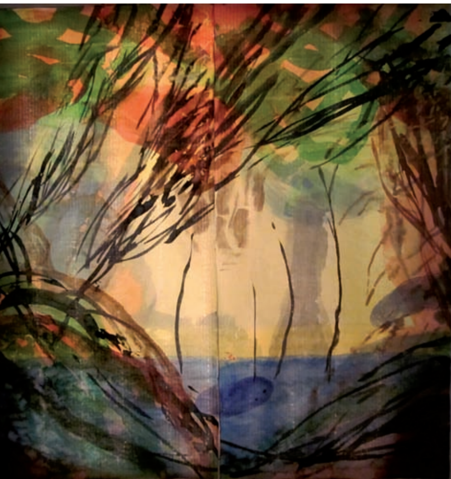
Bosc del Pla , 2011. Tintes damunt paper oriental 200 x 200 cm. Exposició De casa nostra a casa vostra . Altell de Banyoles.