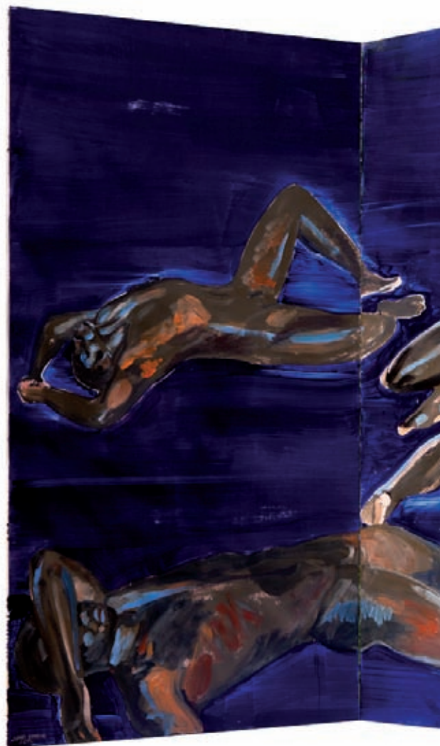
El rai , 2012. Tríptic. Oli damunt fusta. 210 x 320 cm. Exposició Orígens , a la Fundació Valvi de Girona.

núncia n'amplifica les sensacions per transmetre'ns la fortor, la gelor blava, d'aquesta realitat quotidiana.