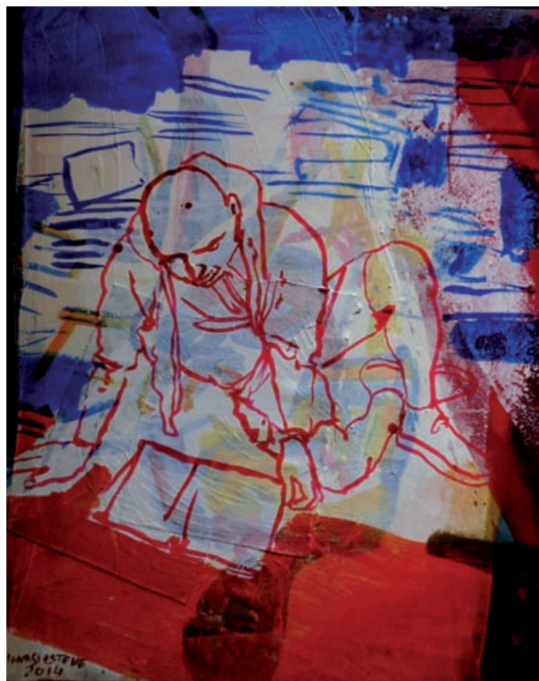
Lector 2, 2014. Acrílic i tintes damunt tela, 100 x 70 cm.

dí, també fa incursions cada cop menys esporàdiques en el gènere paisatge, tant amb minúscules aquarel·les —com les que l'acompanyen en els viatges— com amb enormes espais compositius que conflueixen en la seva decidida i inapel·lable voluntat bel·ligerant a favor de la conservació paisatgística. En el quadre Pla del Bosc atrapa l'esperit d'un paisatge com aquells desconeguts pintors japonesos o els grans poetes del haiku, aquell «menys és més» amb què dauren la natura sense que els sigui permès destorbar-la, amb pinzellades aquoses, lliures, transparents, que ens guien a l'origen, a l'essència de la deua vital.